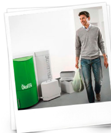
Die Komfort-Aschebox ist im Einfamilienhaus nur ca. ein- bis dreimal jährlich zu entleeren - absolut staubfrei.